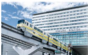
JR小倉駅 ・・・車で6分(約3,500m)