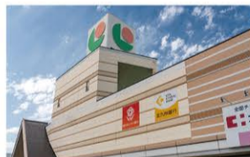
マルシヨク富野店 ・・・徒歩10分(約800m)