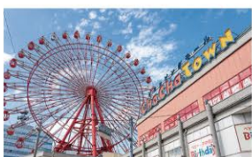
チャチャタウン小倉 ・・・車で4分(約2,400m)