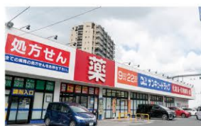
サンキュードラッグ ・・・徒歩10分(約800m)

※徒歩分は1分=80mで計算しています。車による所要時間は時速40kmで計算していますが、道路状況により多少異なる場合があります。 ※掲載の地図は一部施設を省略しております。また、2023年7月現在の現況であり、将来変わることがあります。