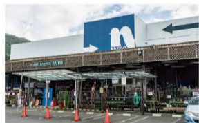
ホームプラザナフコ富野店 ・・・車で2分(約1,000m)