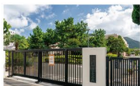
福岡教育大学附属小倉中学校 ・・・徒歩12分(約900m)