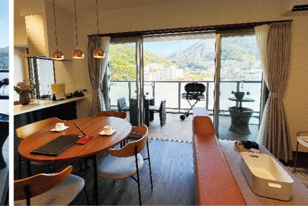
IWAKI MANSION SUGAMACHI THE URBAN OASIS