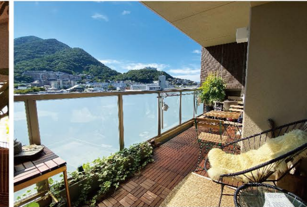
※掲載の写真は実物モデルルームを撮影(2023年9月)したものに一部CG加工を施しております。