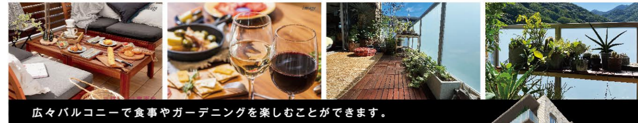
広々バルコニーで食事やガーデニングを楽しむことができます。

「バイオフィリア効果」自然を感じることで、幸福度の向上、生産性の向上、創造性の向上などのプラスの影響をもたらす効果。