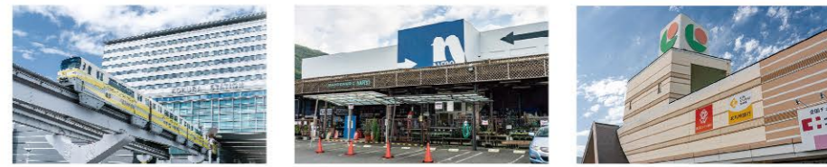
JR小倉駅・・・車で6分(約3,500m) ホームプラザナフコ富野店・・・車で2分(約1,000m) マルシヨク富野店・・・徒歩10分(約800m)