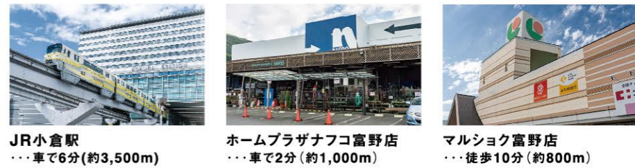
JR小倉駅 ...車で6分(約3,500m) ホームプラザナフコ富野店 ...車で2分(約1,000m) マルシヨク富野店 ...徒歩10分(約800m)