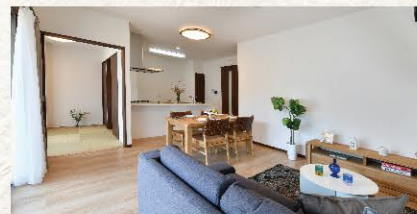
※掲載の写真は、現地モデルルームを撮影(2023年9月)したものです。なお、家具・照明器具・小物等は、販売価格に含まれておりません。詳しくは係員までお尋ねください。