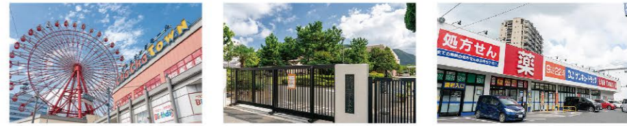
チャチャタウン小倉・・・車で4分(約2,400m) 福岡教育大学附属小倉中学校・・・徒歩12分(約900m) サンキョードラッグ・・・徒歩10分(約800m)

※徒歩分数は1分=80mで計算しています。車による所要時間は時速40kmで計算していますが、道路状況により多少異なる場合があります。 ※掲載の地図は一部施設を省略しております。また、2023年11月現在の現況であり、将来変更することがあります。