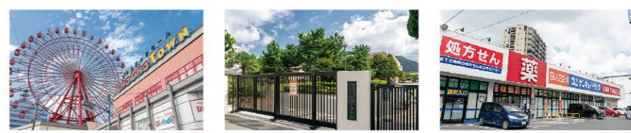
チャチャタウン小倉 ...車で4分(約2,400m) 福岡教育大学附属小倉中学校 ...徒歩12分(約900m) サンキョードラッグ ...徒歩10分(約800m)

※徒歩分数は1分=80mで計算しています。車による所要時間は時速40kmで計算していますが、道路状況により多少異なる場合があります。※掲載の地図は一部施設を省略しております。また、2023年11月現在の現況であり、将来変更することがあります。