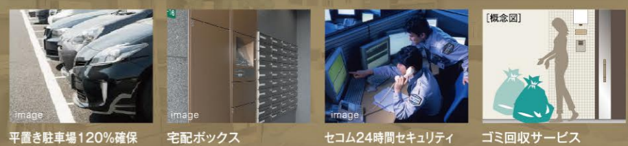
平置き駐車場120%確保 宅配ボックス セコム24時間セキュリティ ゴミ回収サービス